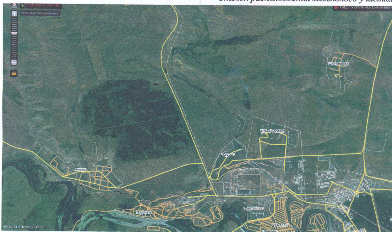
Снимок расположения земельного участка.

В соответствии с правилами, установленными разделом VI Федерального стандарта оценки ФСО-7, п. 12 Анализ наиболее эффективного использования лежит в основе оценок рыночной стоимости недвижимости.